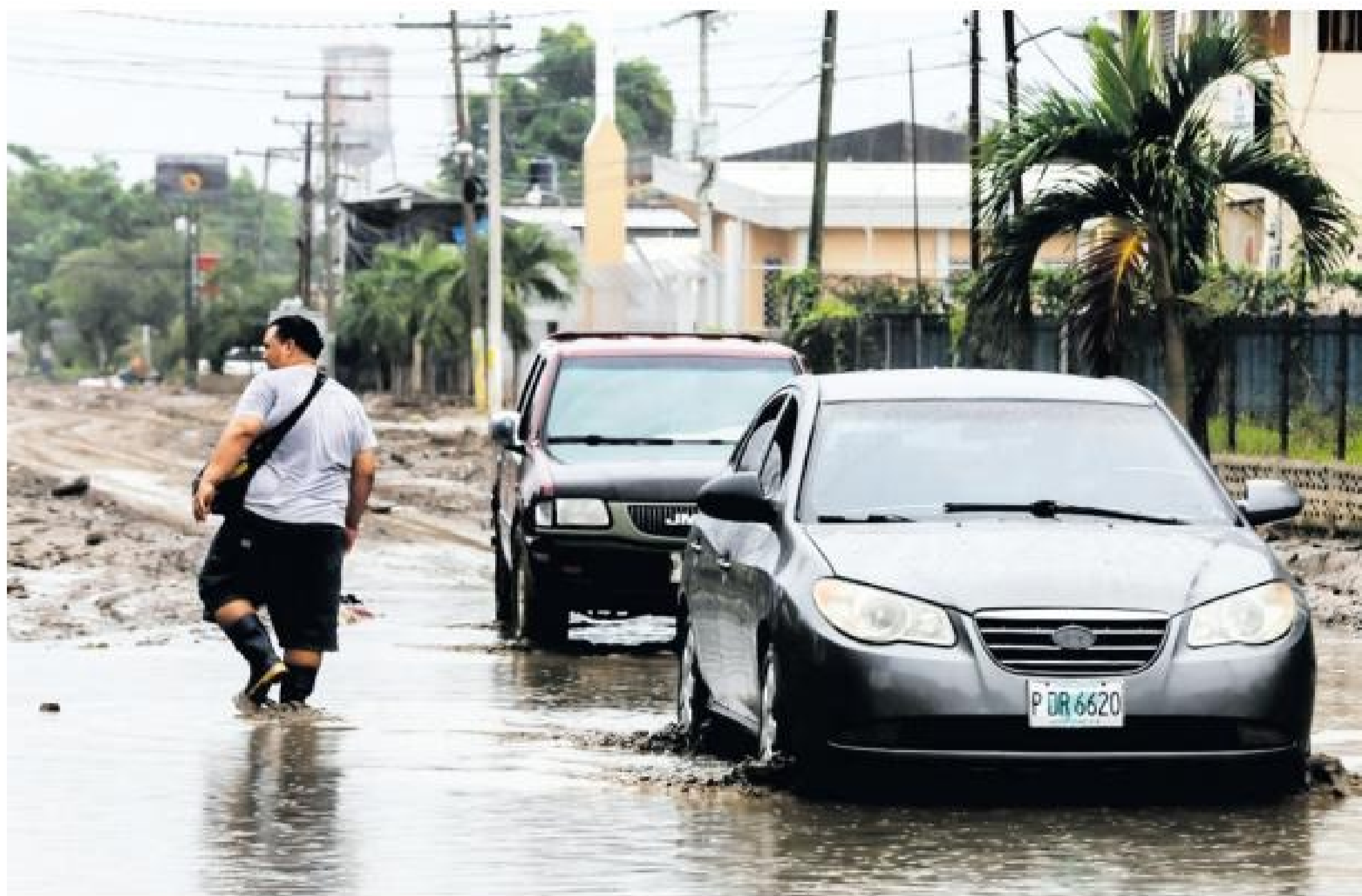
Andres y Providencia, Useche ta adverti, kende

Iota a intensifica dialuna y a alcanza e maximo categoria di horcan, 5, riba su ruta pa Centroamerica, cu cual ta existi un "posibilidad halto di algun precipitacion, compana di actividad electrico y biontonan fuerte" den e parti west di Caribe Colombiano y na e archipelago di San